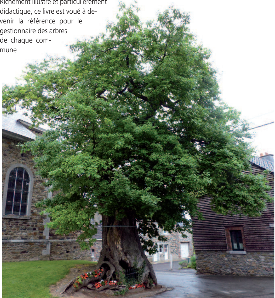
Le chêne de l'église Saint-Lambert, à Sart-lez-Spa (Jalhay), où il se dit que Charlemagne rendait la justice.

Richement illustré et particulièrement didactique, ce livre est voué à devenir la référence pour le gestionnaire des arbres de chaque commune.