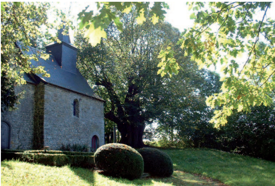
Troisième tilleul commun de Wallonie, le tilleul de Doyon trône harmonieusement face à la chapelle Saint-Nicolas.